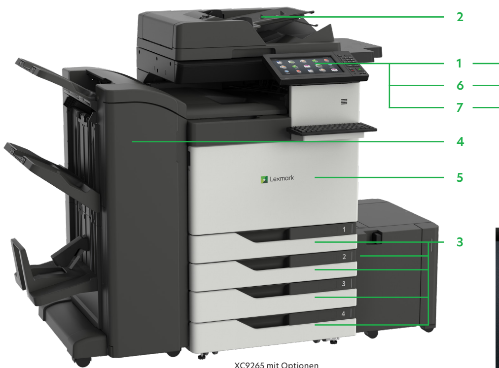
XC9265 mit Optionen

Drucken Sie Microsoft Office-Dateien, PDFs und andere Dokument- und Bildarten von Flash-Laufwerken, oder wählen Sie Dokumente auf Netzwerk-Servern oder Online-Laufwerken aus und drucken Sie sie.